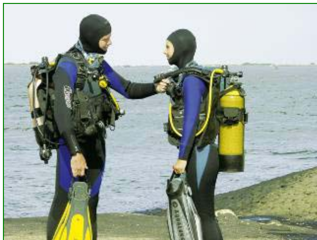
Het controleren van je buddy. Net voor de duik.

Om te gaan duiken heb je een brevet nodig. Dit is een diploma dat je krijgt als je een duikopleiding hebt gevolgd. Er zijn verschillende brevetten die je kunt halen en hierop staat aangegeven hoe ver je onder water mag en wat je allemaal al kan. Er zijn vier brevetten die je kunt halen en als je dan nog verder wilt, dan kan je zelfs instructeur (duikleraar) worden.