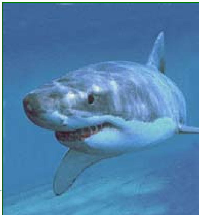
De haai: hij ziet er heel gevaarlijk uit, maar de meeste haaiensoorten zijn bang voor mensen en blijven dus uit de buurt van duikers.

Risico's zijn gevaren voor verlies of schade. En in ons geval gaat het dan om schade aan onze gezondheid. Omdat we ons in een omgeving begeven waar we eigenlijk niet in thuishoren, lopen we bij het duiken risico's. Als we weten wat die risico's zijn en hoe we die zo klein mogelijk kunnen houden, is er eigenlijk geen sprake meer van een gevaar. Daarom wordt er in de opleiding zoveel aandacht aan theoretische kennis besteed. Daarnaast is ervaring natuurlijk een heel goede leermeester.