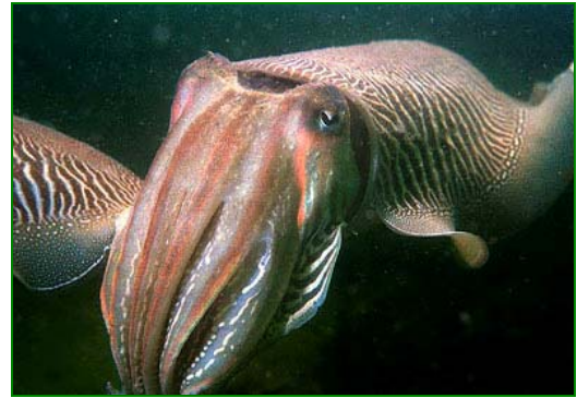
Deze inktvissoort heet sepia. Hij komt veel voor in Zeeland.

Via www.anemoon.org kun je ook mooie plaatjes vinden, dan moet je zoeken bij biologie en dan een soortengroep aanklikken, hier kan je mooie afbeeldingen vinden.