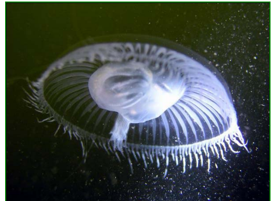
Kwallen zijn er in de prachtigste vormen en soorten.