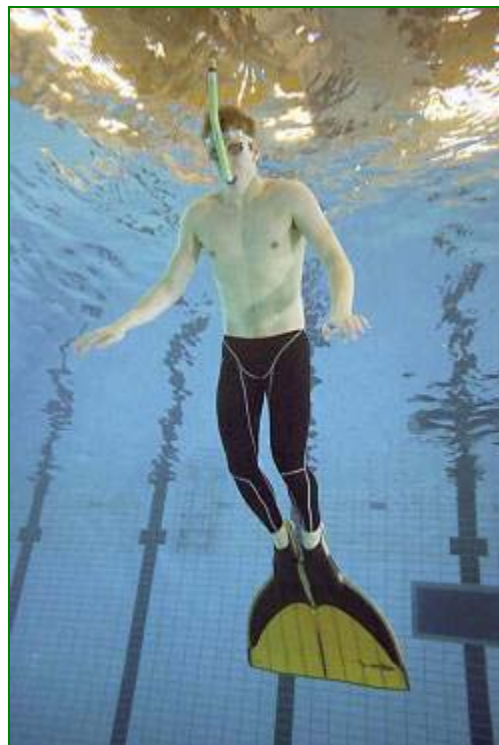
Een vinzwemmer met monovin.

Vinzwemmen is de snelste zwemsport waarbij er gebruik wordt gemaakt van zwemvliezen of een monovin. De vinzwemmer zwemt met een snorkel, of onder water met een persluchtflesje of met eigen adem. Een vinzwemmer kan grote snelheden bereiken. Vinzwemmen is daarom de snelste zwemsport! De tijden die op de verschillende afstanden gezwommen worden zijn veel sneller dan van het gewone zwemmen. De tijden van de wereldrecords vinzwemmen zijn dan ook snel. Heel snel! Het vinzwemmen is spectaculair voor toeschouwers. Bij de sprintafstanden ontstaan soms zulke grote golven dat de voeten van het publiek niet altijd droog blijven. Natuurlijk is vinzwemmen niet alleen voor wedstrijdzwemmers. Ook recreatief is vinzwemmen een bijzondere ervaring en heel leuk om te doen. Meer informatie vind je via www.vinzwemmen.org .