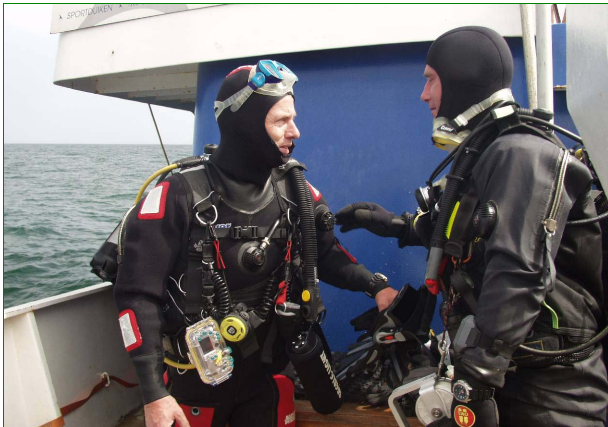
Wrakduiken op de Noorzee.

Duiken kan iedereen leren. Hiervoor moet je je net als bij voetbal aansluiten bij een club of vereniging. Je kunt ook een duikcursus volgen, dit kan je doen bij een duikclub. Bij de eerste paar lessen ga je natuurlijk nog niet meteen de zee in, want je moet het eerst nog leren en daarvoor oefen je in het zwembad.